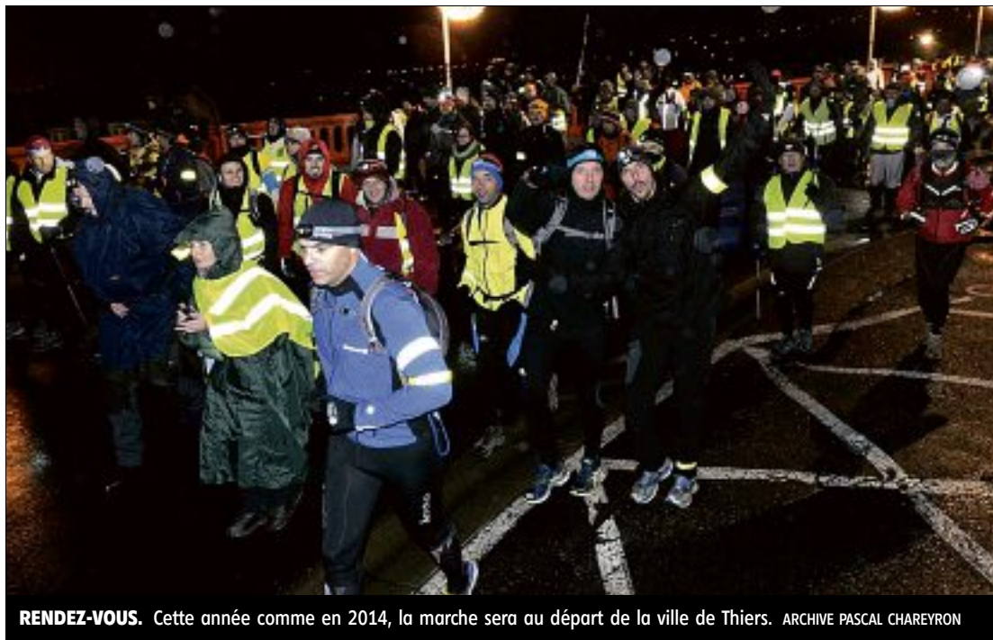
RENDEZ-VOUS. Cette année comme en 2014, la marche sera au départ de la ville de Thiers.

De Roanne à Thiers, tout le monde connaît l'anecdote qui fait désormais partie de l'histoire. En 1925, trois amis, après avoir vu un film au cinéma de Roanne, prennent le pari de terminer leur soirée chez l'un des trois compères. L'histoire serait tombée dans l'oubli si ce dernier n'habitait pas Thiers et que nos trois bons amis n'avaient pas effectué le chemin à pieds. Inconscience ? « C'est plutôt qu'ils devaient être bien